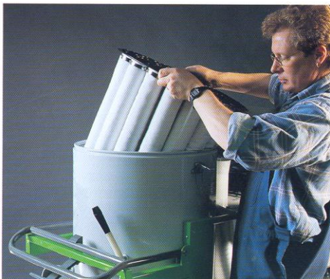
Filtre à manches