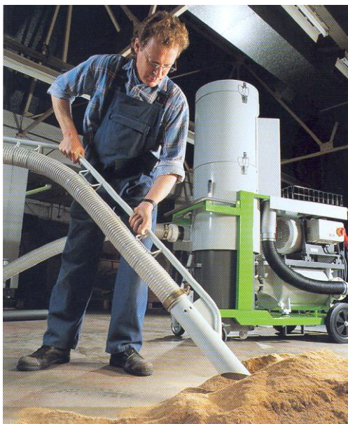
Reprise en tas