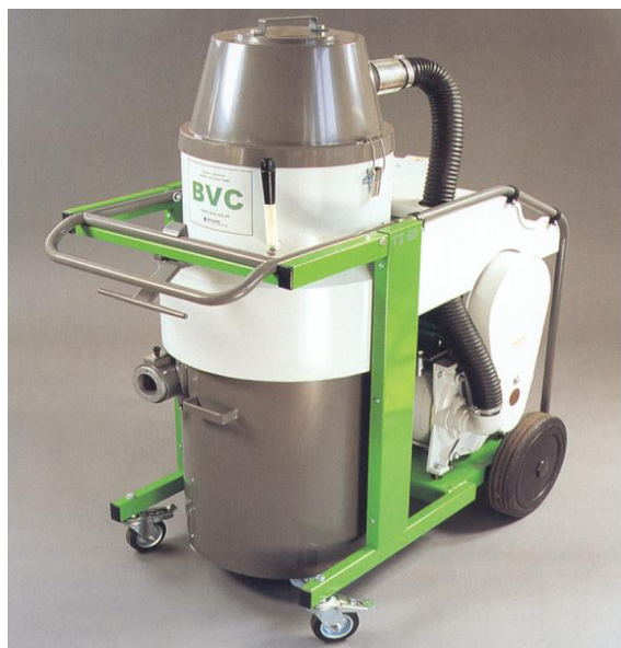
Ti 60 moteur 4kw