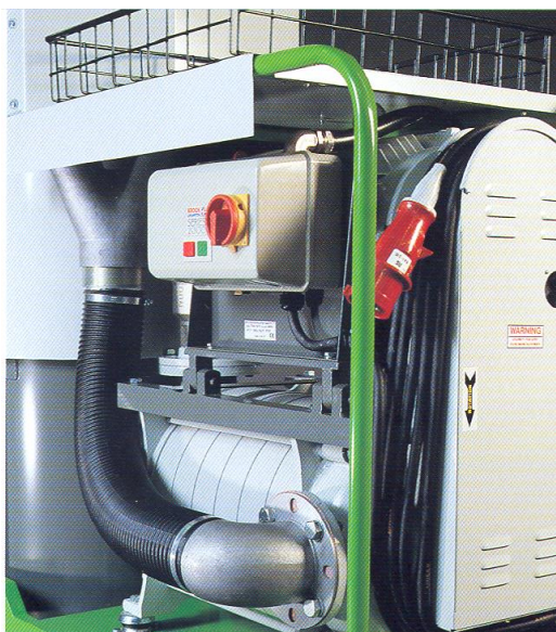
Turbine BVC centrifuge multi-étagée